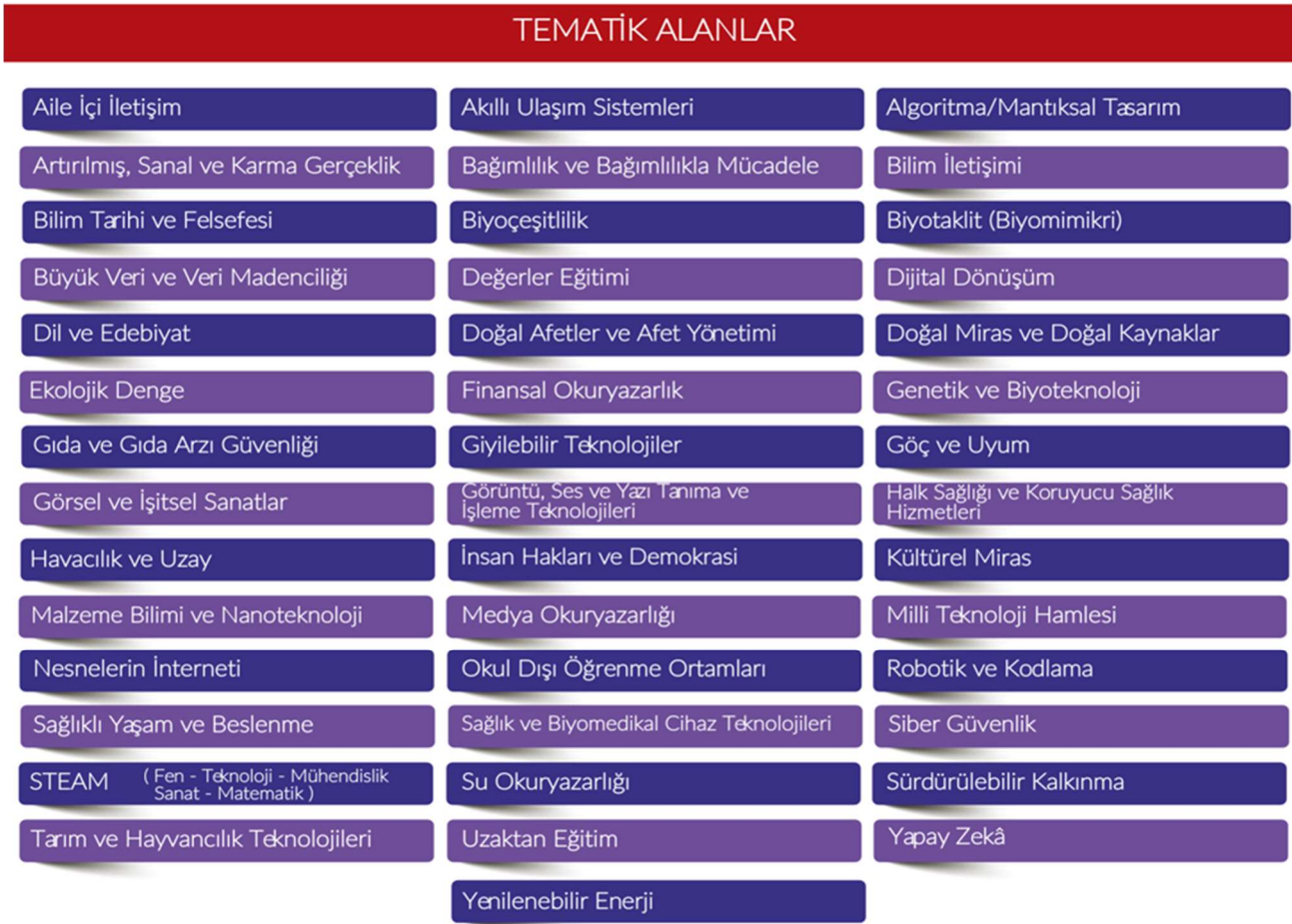
Şekil 3. Tematik Alanlar

Bu ana alanlarda yarışmaya başvuracak projelerin, aşağıda isimleri verilen tematik alanlardan birini kapsayacak şekilde hazırlanmış olması gerekir (Şekil 3).