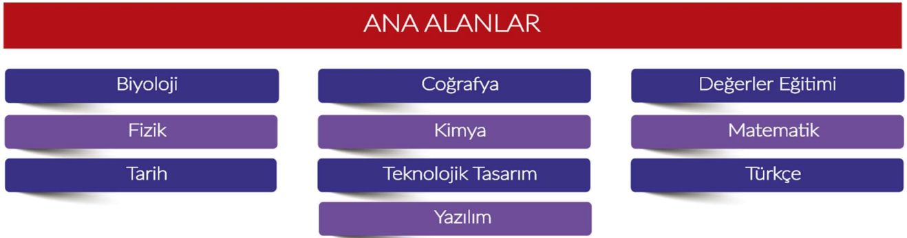
Şekil 2. Ana Alanlar

Yarışma, 10 ana alanda düzenlenmektedir (Şekil 2).